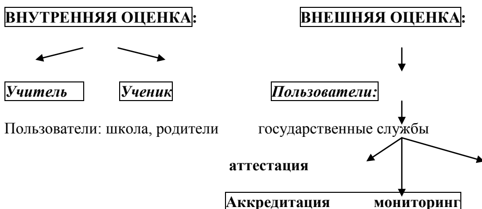
Схема процедуры оценочной деятельности.

Система оценки достижения планируемых результатов включает в себя две согласованные между собой системы оценок: внешнюю оценку (оценку, осуществляемую внешними по отношению к школе службами) и внутреннюю оценку (оценку, осуществляемую самой школой).